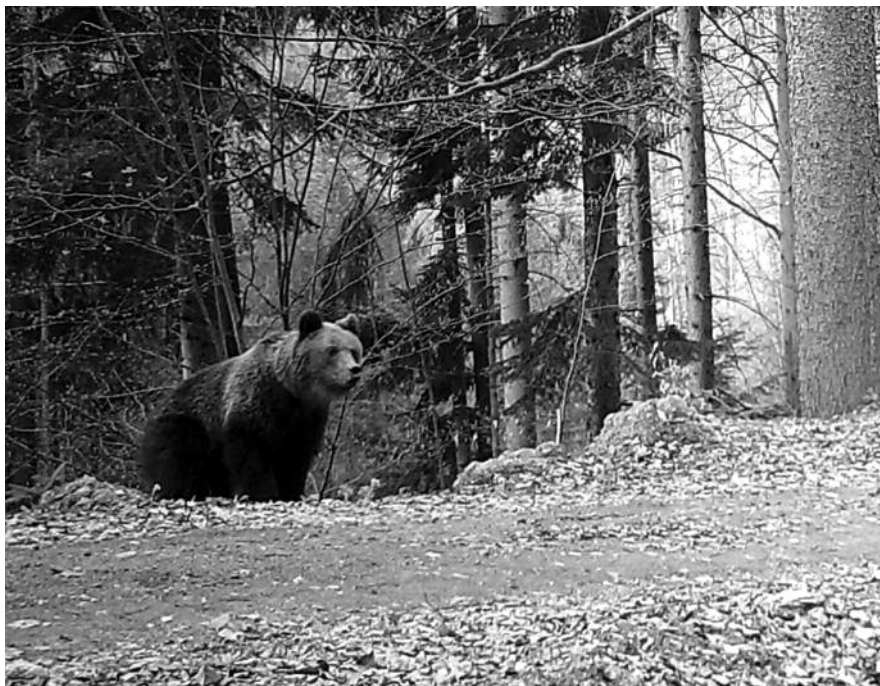
Selce, lokalita Roháčová, 17.4.2015

Voda netečie z vodovodu, ale najčastejšie sa „zbiera“ niekde v lesoch. Lesy tlmia hluk, znižujú množstvo prachu v našom okolí a sú útočiskom rozličných druhov rastlín a živočíchov. Lesy sú našimi pľúcami, rezervoármi pitnej vody. Plnia zdravotnú aj rekreačnú úlohu. V lese nič nevyjde nazmar, všetko má svoje miesto, význam a trvanie... prirodzený kolobeh života. My ľudia si myslíme, že